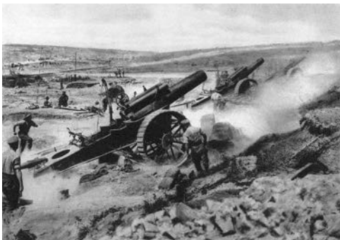
Deutsche Artillerie beschießt ein belgisches Fort im August 1914

Aber auf dem halben Wege nach Herbesthal, der ersten deutschen Station, blieb plötzlich der Zug auf freiem Felde stehen. Wir drängten in den Gängen zu den Fenstern.