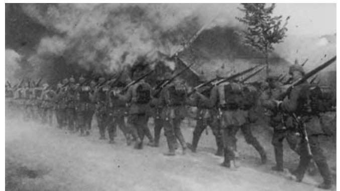
Deutsche Infanterie auf dem Vormarsch durch Belgien im August 1914

Was war geschehen? Und da sah ich im Dunklen einen Lastzug nach dem andern uns entgegenkommen, offene Waggons, mit Plachen bedeckt, unter denen ich undeutlich die drohenden Formen von Kanonen zu erkennen glaubte. Mir stockte das Herz. Das musste der Vormarsch der deutschen Armee sein. Aber vielleicht, tröstete ich mich, war es doch nur eine Schutzmaßnahme, nur eine Drohung mit Mobilisation und nicht die Mobilisation selbst. Immer wird ja in den Stunden der Gefahr der Wille, noch einmal zu hoffen, riesengroß. Endlich kam das Signal ›Strecke frei‹ der Zug rollte weiter und lief in der Station Herbesthal ein. Ich sprang mit einem Ruck die Stufen hinunter, eine Zeitung zu holen und