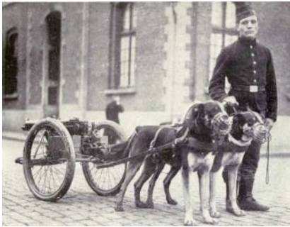
Belgischer Mitrailleur 1914

Aber die schlimmen Nachrichten häuften sich und wurden immer bedrohlicher. Erst das Ultimatum Österreichs an Serbien, die ausweichende Antwort darauf, Telegramme zwischen den Monarchen und schließlich die kaum mehr verborgenen Mobilisationen. Es hielt mich nicht mehr länger in dem engen, abgelegenen Ort. Ich fuhr jeden Tag mit der kleinen elektrischen Bahn nach Ostende hinüber, um den Nachrichten näher zu sein; und sie wurden immer schlimmer. Noch badeten die Leute, noch waren die Hotels voll, noch drängten sich auf der Digue promenierende, lachende, schwatzende Sommergäste. Aber zum ersten Mal schob sich etwas Neues dazwischen. Plötzlich sah man belgische Soldaten auftauchen, die sonst nie den Strand betraten. Maschinengewehre wurden – eine sonderbare Eigenheit der belgischen Armee – von Hunden auf kleinen Wagen gezogen.