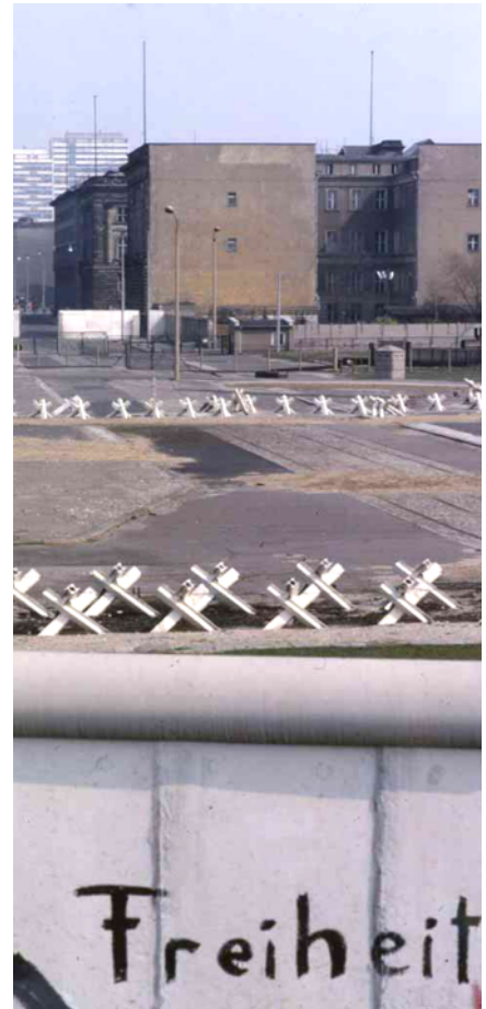
Blick über die Mauer nach Ostberlin.