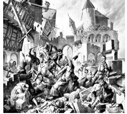
Das Erdbeben zu Basel von 1356 (Schulwandbild aus dem 19. Jh.)