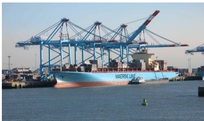
Hafenanlagen von Zeebrügge

Belgien liegt zwischen Frankreich, Luxemburg, den Niederlanden und Deutschland. In Belgien leben hauptsächlich zwei Volksgruppen: die französischsprachigen Wallonen im Süden und die flämischsprachigen Flamen im Norden. Brüssel ist sowohl die Hauptstadt von Belgien wie die auch von der Europäischen Union.