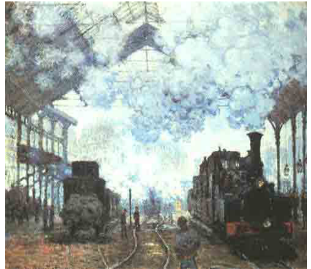
CLAUDE MONET: „GARE SAINT LAZARE“ 1877

Als 1804 die Dampflokomotive erfunden wurde, entstand im Laufe der Zeit ein Netz von Zugverbindungen.