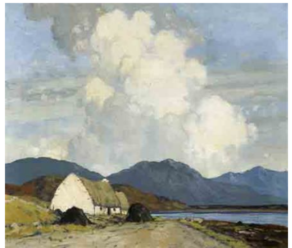
Landschaft Connemara PAUL HENRY, 1930