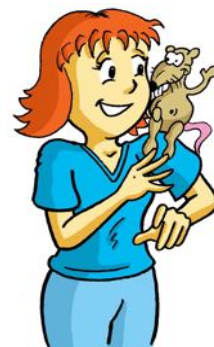
Lena's Hausratte Lenas Hausratte