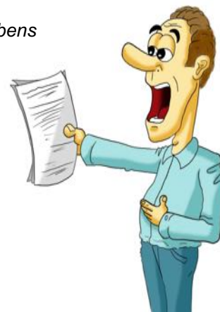
der Inhalt der Rede